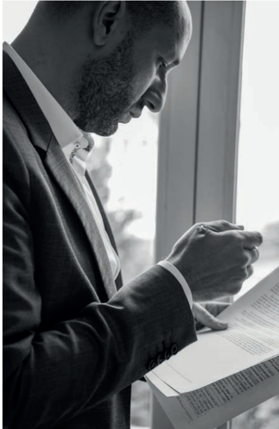
Bureaux Cabinet Coppet Avocats, Paris

Avocat spécialiste en droit du dommage corporel, Défense des victimes 42 ans